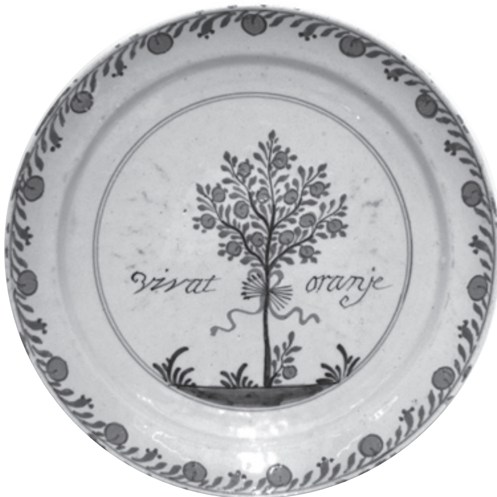
Schotel, polychroom, met een oranjeboom en het opschrift 'Vivat Oranje' (Collectie Drents Museum)

Toeschouwers hadden bij het bewonderen van de nachtelijke verlichtingen gezegd dat zij op het platteland nog nooit zo iets fraais hadden gezien. Om middernacht was er vuurwerk geweest. In de herberg had Van Heiden de officieren van de schutterij ontvangen, die vrijwillig een kort gedicht over de dag hadden opgesteld en een wedstrijd hadden gehouden wie het beste vers kon schrijven.