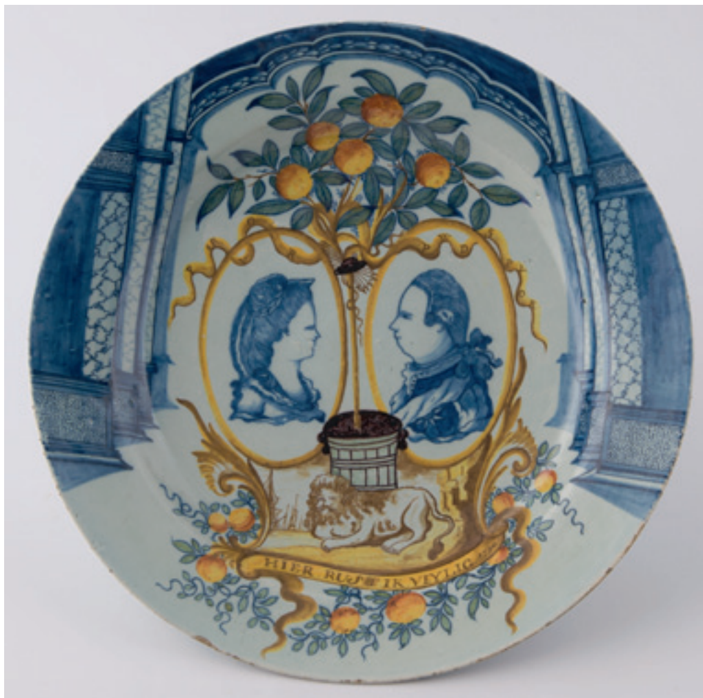
Schotel, polychroom, met portretten van Willem V en Wilhelmina, ten weerszijden van een Oranjeboom met rustende leeuw, gedateerd 1790