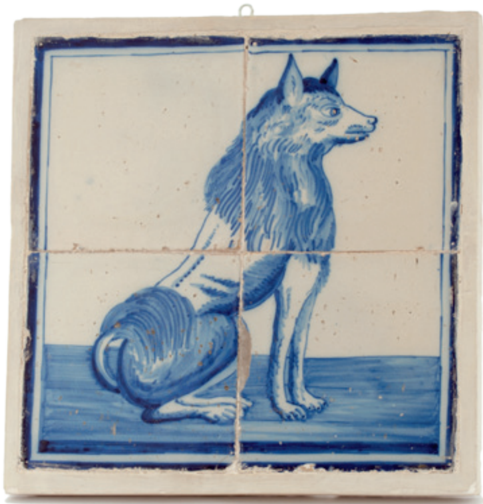
Tegeltabelau met een keeshond. De keeshond was het symbool van de patriotten

ling afspraken werden gemaakt. Ook in zijn dagboeken laat Van Heiden zich niet uit over zijn belang of bemoeienis met de 'Ouw. Patriot', zoals hij het blad op 13 december 1781 aanduidde. Hij maakte op dat moment slechts melding van het (achteraf gezien tijdelijke) staken van de productie door de 'schrijvers en drukkers (...), ontmoedigd door belemmeringen van allerlei soort die men hen in de weg legt.' Impliciet gaf Van Heiden hiermee aan op de hoogte te zijn van het feit dat er problemen waren. Er was inderdaad sprake van de drukker Gosse die wenste te stoppen vanwege patriotse hatemail en teruglopende inkomsten bij de 's-Gravenhaagsche Courant, gebrek aan kopij en stagnerende medewerking van Van Goens. Het laatste had te maken met de opname van antipapistische en anti-Franse stukken van nieuwe auteurs die Ten Hove had aangezocht. De libertijnse Van Goens moest niets daarvan hebben. 15 Nog belangrijker echter was dat Hendrik Fagel zich tegen het blad had gekeerd, wellicht geschrokken van de mogelijke consequenties van de anti-Franse toonzetting.